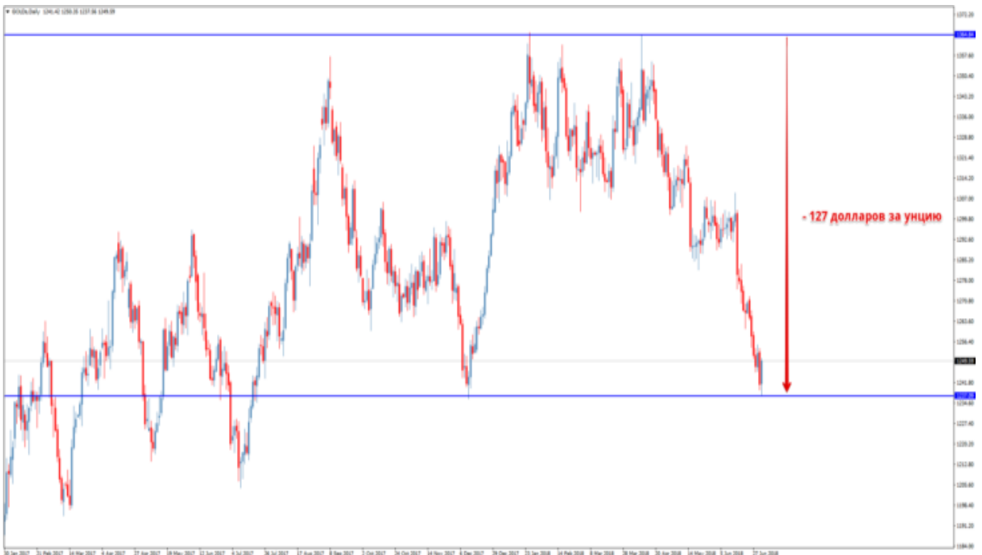
Рис. 2. Падение золота — еще одна причина уменьшения ЗВР.

Золотовалютные резервы, как это понятно из названия, состоят не только из валют, но и из золота. Так может, ситуация с золотом получше?