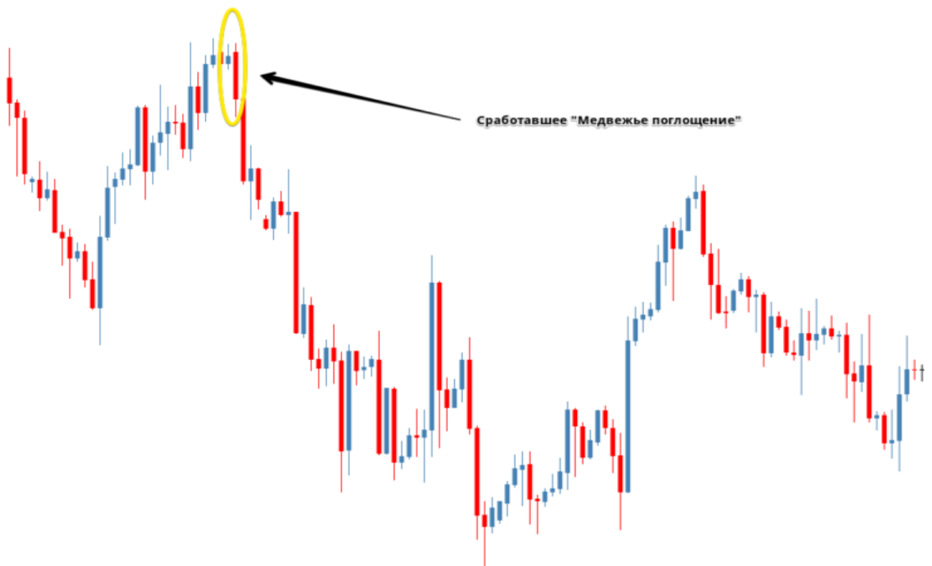
Рис. 3. Пример правильно отработанного «Медвежьего поглощения».

Исходные условия формирования сетапа те же самые, но результат совершенно обратный. Как и предполагалось, после возникновения «Медвежьего поглощения» восходящая тенденция закончилась, цена развернулась и началась нисходящая тенденция.