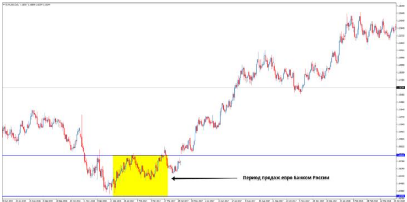
Рис. 1. Зона продажи евро за доллары Банком России.

И, как это обычно бывает, после такой «удачной» сделки, во втором квартале курс евро к доллару развернулся и начал рост, к концу 2017 года дойдя до отметки 1,2, тем самым прибавив к стоимости евро 13,8%.