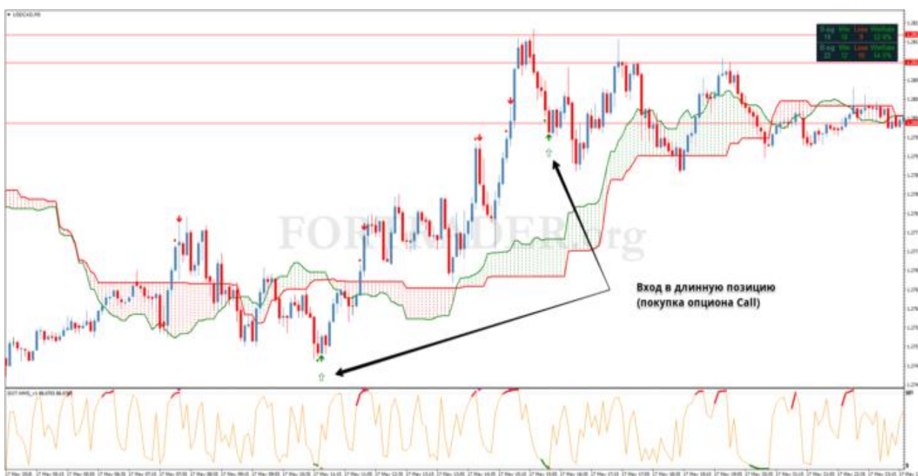
Пример входа в длинную позицию (покупка опциона Call)