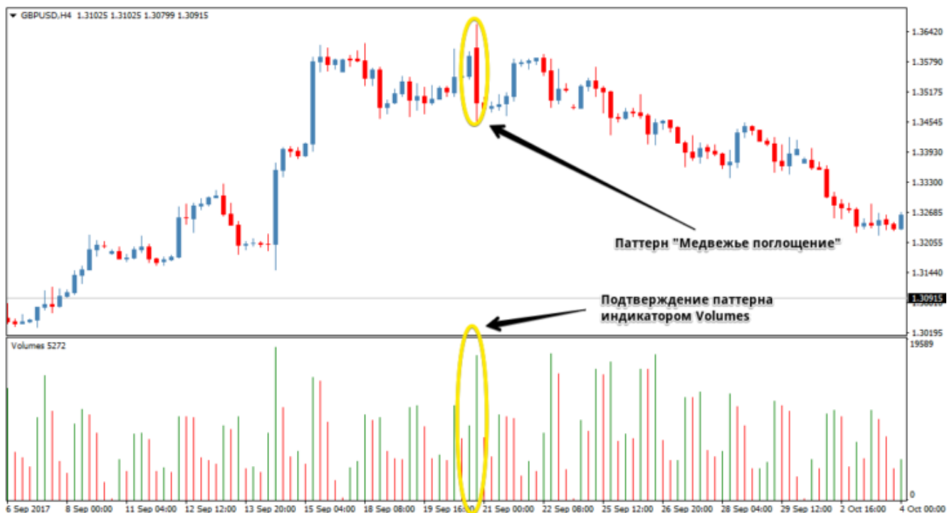
Рис. 4. Медвежье поглощение с добавленным в него индикатором объема.

При этом разница объемов, зачастую, указывает на потенциал паттерна. Например, если объем на второй свече на 30%-40% больше, чем на первой, то отработка фигуры может принести хорошую прибыль.