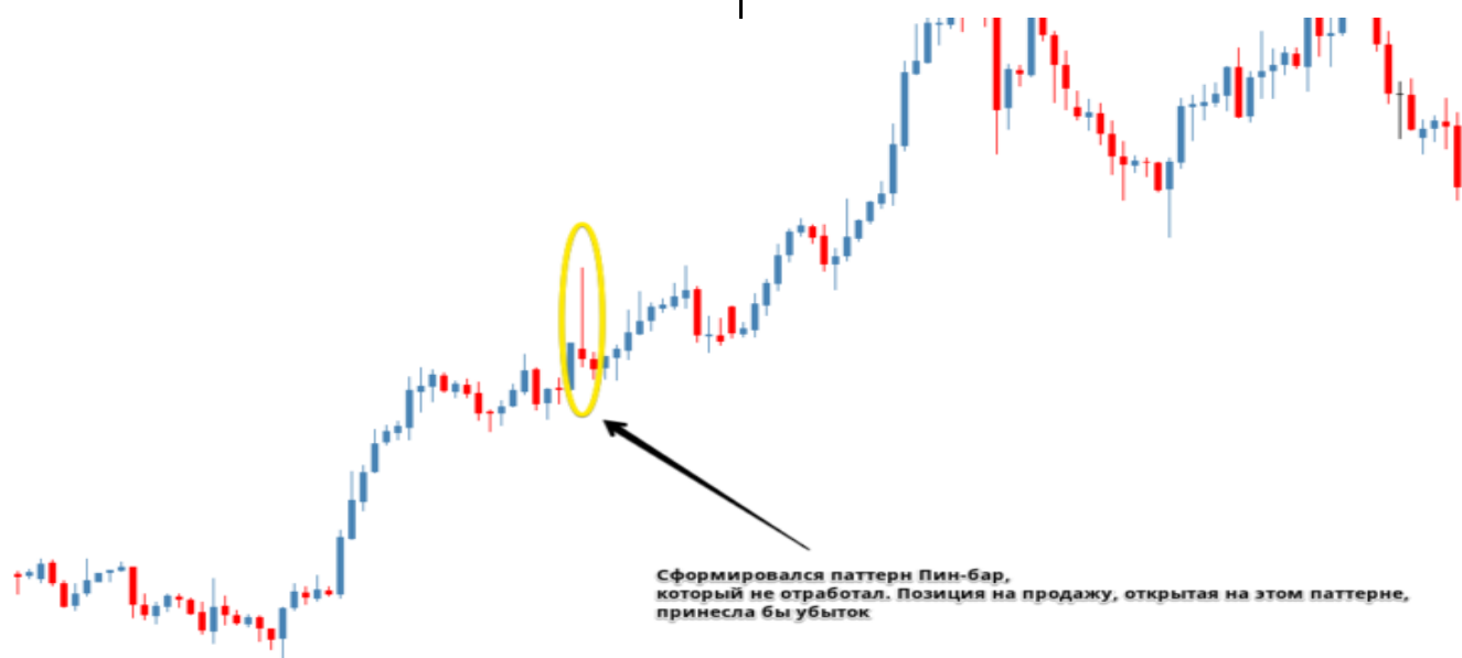
Рис. 1. Пример ложного убыточного Пин-бара

Например, следующая ситуация. На графике сформирован паттерн Price Action, известный как Pin-bar (Пин-бар). Это разворотная модель, сигнализирующая о том, что на рынке поменялись настроения. Выглядит Пин-бар как свеча с маленьким телом, длинным хвостом с одной стороны и коротким с другой. При этом тело свечи должно лежать в пределах High-Low предыдущей свечи. Предполагается, что возникновение паттерна предшествует развороту цены.