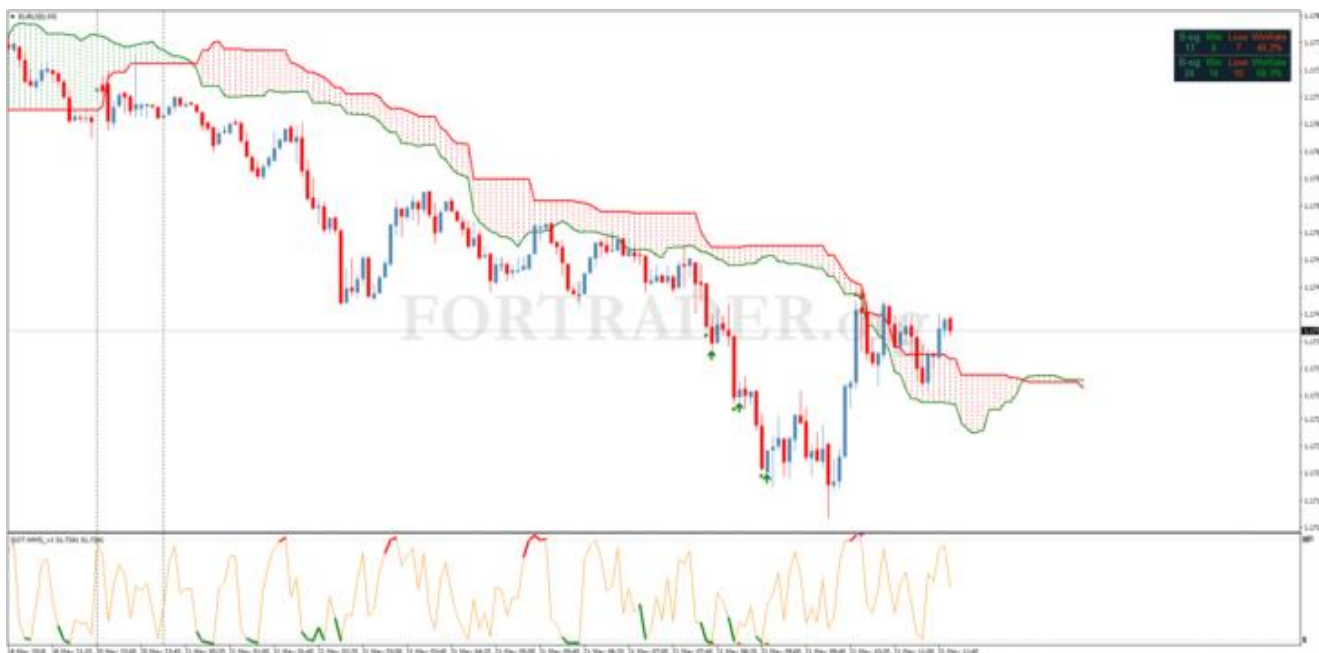
Шаблон торговой стратегии Ichimoku Stochastic Scalping