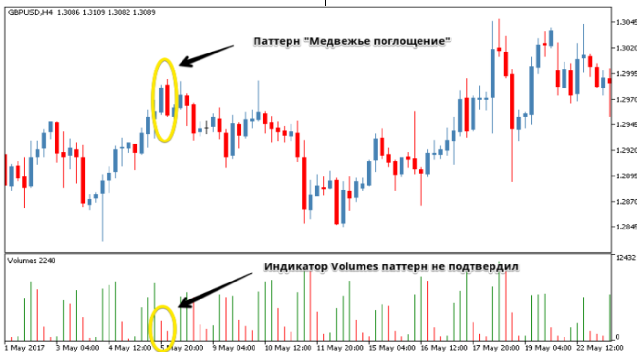
Рис. 5. Как объемы показывают на то, что сигнал ложный.

А вот пример того, как использование индикатора Volumes может уберечь трейдера от убытка.