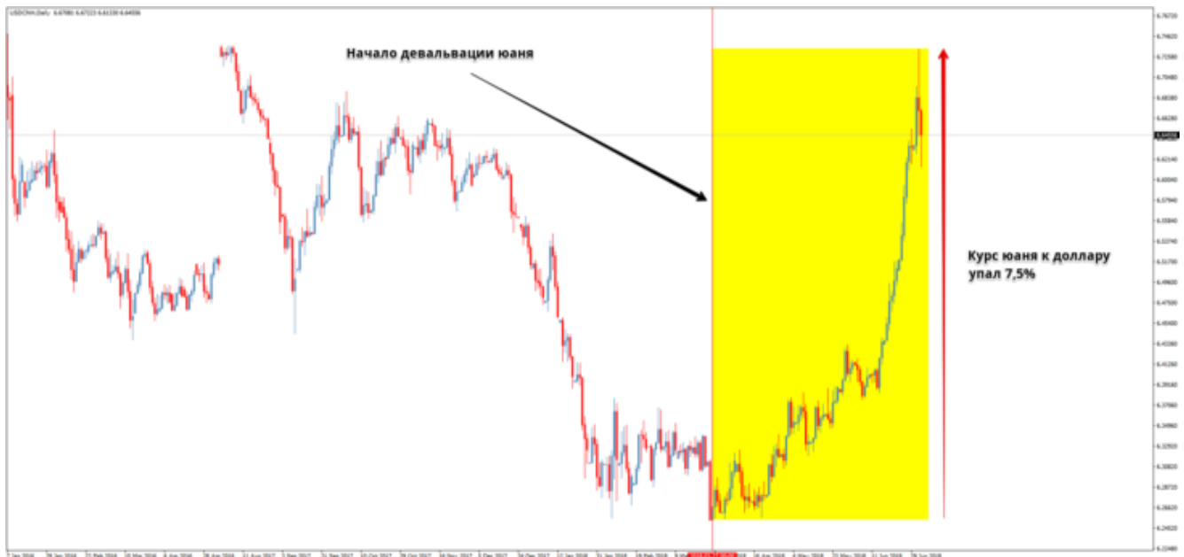
Рис. 3. Нарастивание объемов юаня в момент девальвации.

периода. Так вот, в самом начале июля ЦБ РФ опубликовал отчет, из которого следует, что четвертом квартале регулятор увеличил долю ЗВР в юанях в целых три раза и теперь сравнялся с долей резервов в канадских долларах (3,1%). При этом, операции с юанем Банк России начал проводить с четвертого квартала 2015 года. До недавнего времени, доля резервов в юанях составляла всего лишь 0,1% от общего объема.