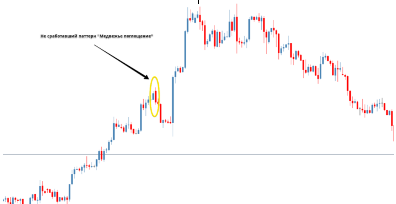
Рис. 2. Пример ложного убыточного «Медвежьего поглощения».

Такая ситуация может возникнуть с любыми паттернами.