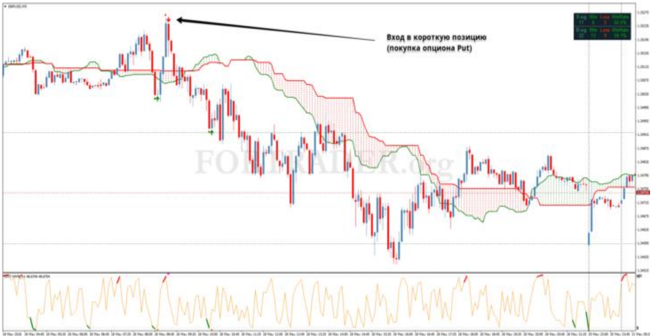
Пример входа в короткую позицию (покупка опциона Put)